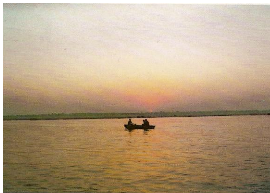
Cảnh bình minh trên Sông Hằng

Chúng tôi đã đến sông Hằng bằng những gì tha thiết - Xe phải đậu ngoài xa - Đầu đường phố để đi vào - Mới sáng sớm mà phố phường rất nhộn nhịp - Người đi đông, mình phải chen chân - Chúng tôi hàng hai, tay cầm lấy nhau để khỏi lạc bầy - Hai bên phố những cửa hàng rất lớn - Lụa là, gấm vóc, đồ trang sức, điểm trang và nhiều thứ - Nhưng nét dơ bẩn cũng không thua gì - Trước hè hiên, hay trên lề đường của người đi bộ, những người bán hoa, vòng chuỗi, quà lưu niệm... được giăng đầy. Tôi có cảm